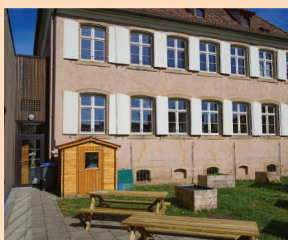
Un nouveau coin détente à l'arrière de la bibliothèque est accessible pendant les heures d'ouverture.

Emmy Besson ayant fait valoir ses droits à la retraite à compter du 31 mai 2023 et la nouvelle recrue n'arrivant que le 12 juin, la bibliothèque sera fermée du 1 er au 13 juin 2023.