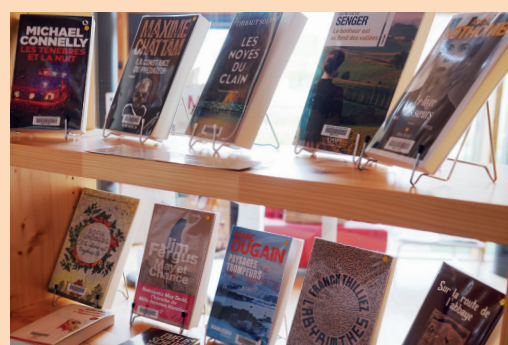
Une offre de nouveautés actualisée régulièrement.