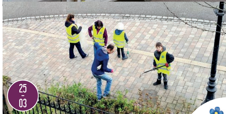
OSTERPUTZ du matin avec les enfants du CMJ. On s'active avec les pinces. De vrais petits crabes !