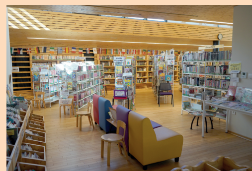
Espace enfants, petit coin au calme pour la lecture.