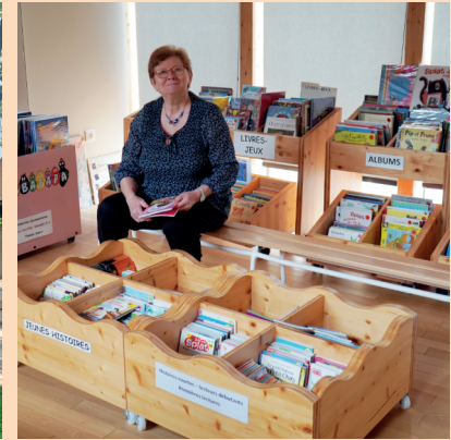
Le coin réservé aux accueils de classe.