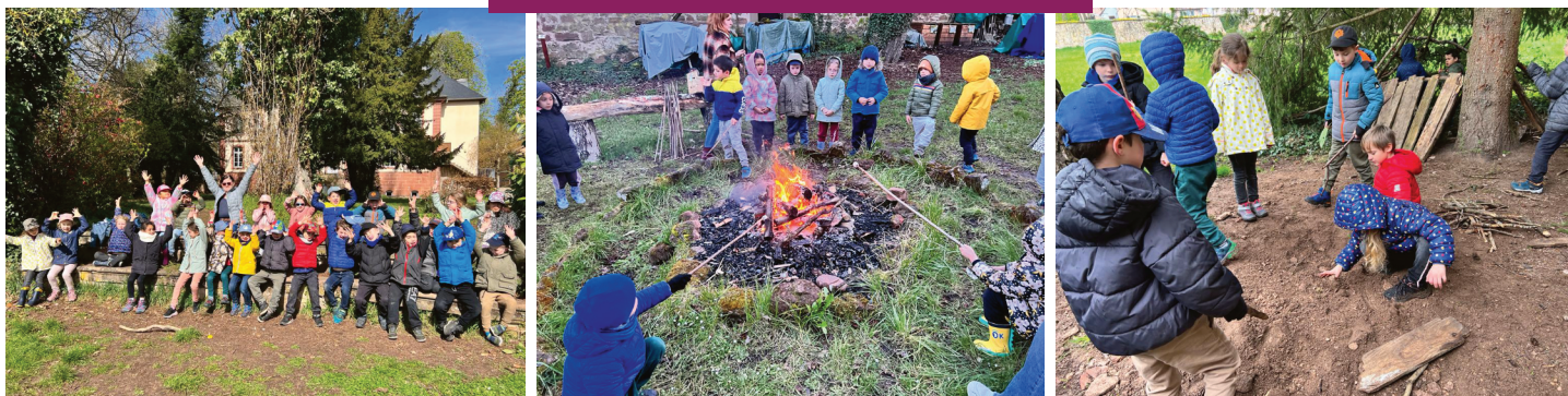
CLASSE DÉCOUVERTE avec l'école maternelle à Neuwiller-les-Saverne du 11 au 14 avril.