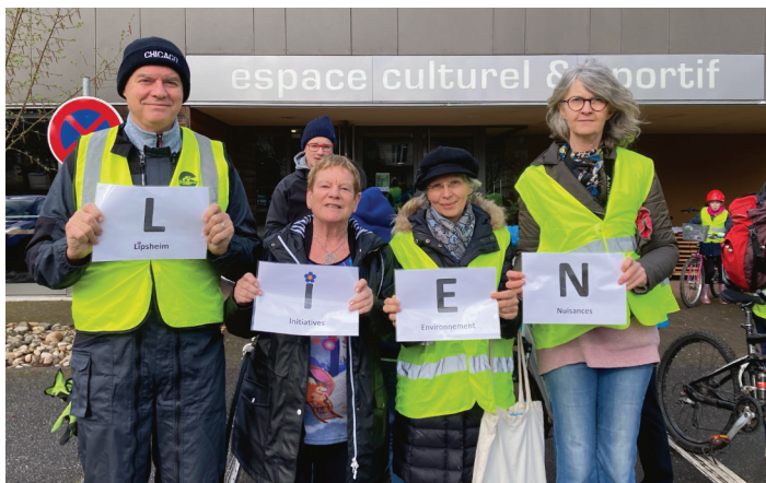
L'association LIEN à l'occasion de l'Osterputz 2023 de Lipsheim.

L'Association Lipsheim Initiatives Environnement et Nuisances œuvre pour la qualité de l'environnement à Lipsheim. Pour la rejoindre, contactez lien.lipsheim@outlook.fr .