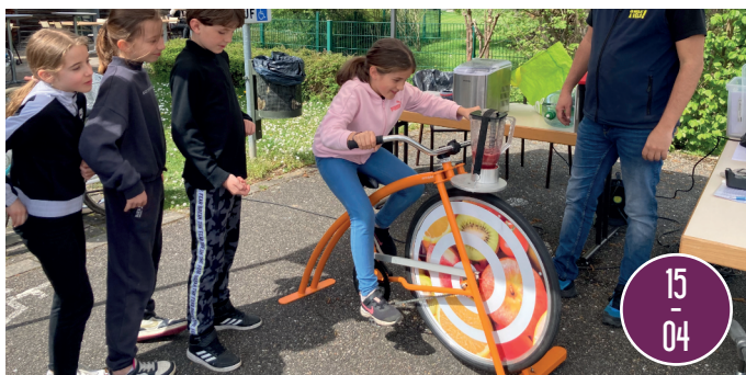
FÊTE DU VÉLO à Lipsheim. La machine à smoothie motive toujours autant !