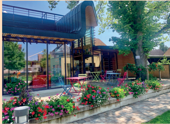
Une jolie terrasse est installée au printemps à l'ombre du tilleul.