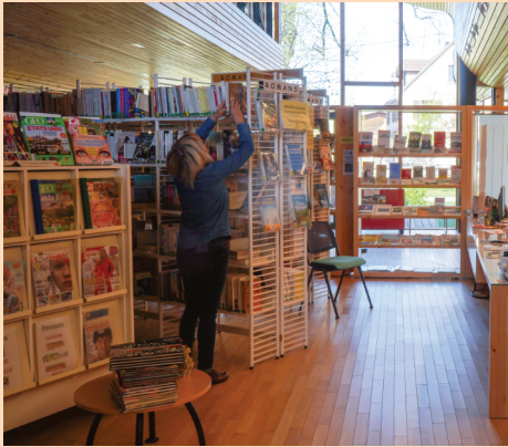
Malgré une légère baisse de lecteurs durant le Covid, le nombre de prêt est en constante augmentation.