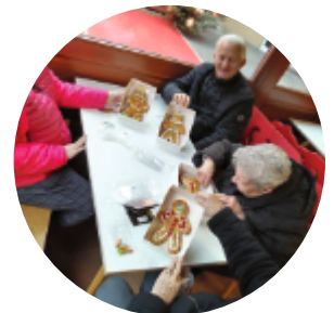
Merci à l'EVS pour la sortie au musée Fortwenger de décembre