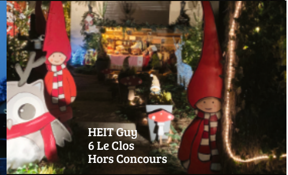
HEIT Guy 6 Le Clos Hors Concours