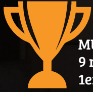
MULLER Marcel 9 rue du Hohwald 1er Prix d'Excellence